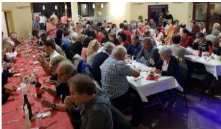
Participation au Repas italien le 28 avril à Saint Denis des Murs .

Participation à l'Assemblée Générale de la Maison de l'Europe le 8 mars à Limoges et à l'Assemblée Générale de l'Association des Communes Jumelées de Nouvelle Aquitaine le 10 mars à Exideuil sur Vienne.